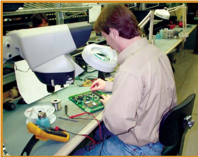
Probamos nuestros diseños para que funcionen con fiabilidad y sin contratiempos.