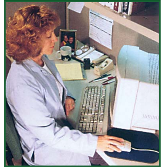
Obtenga acceso a Watchdog de cualquier ordenador conectado al sistema de red.

El sistema Watchdog de Edstrom está diseñado para satisfacer las necesidades especiales de los animalarios. Watchdog integra los sistemas clave del animalario en un sistema completo de almacenamiento de datos y generación de alarmas con una sola interfaz de usuario. Watchdog ofrece funciones de control y supervisión para el acceso a salas, iluminación, sistemas de bebederos automatizados, así como para la vigilancia de la temperatura ambiente, humedad, luz, flujo de aire y presión diferencial.