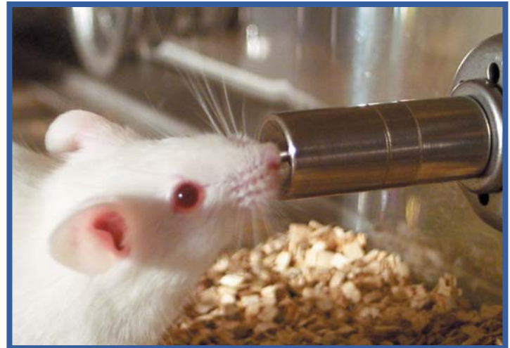
Aus einem abgeschirmten Ventil A160 trinkende Maus

Mit Edstrom-Trinksystemen haben Sie weniger Arbeit, reduzieren Verletzungen durch ungünstige Ergonomie und verbessern Sie die Wasserqualität. Unsere Systeme sind für alle Tierarten konstruiert, u.a. für Mäuse, Ratten, Hunde und nichtmenschliche Primaten. Wir bieten Komplettlösungen von der Umkehrosmose-Wasserreinigung über Wasserverteilungsrohre bis zu Trinkventilen.